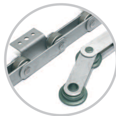
Chaînes de manutention