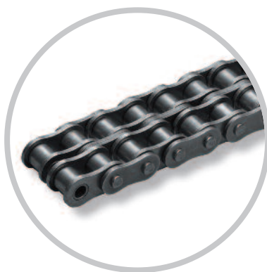
Chaînes à rangées multiples