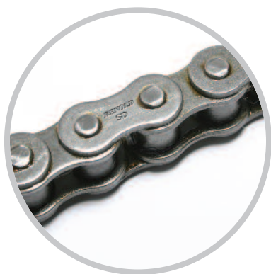
Chaînes de transmission